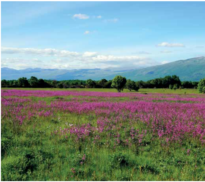
Slika: Bijana Topić – Rumekica (Vascaria vulgaris)