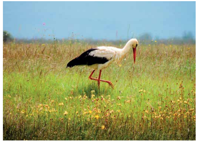
Slika: Miroslav Pudo – Bjelorođ (Ciconia ciconia)