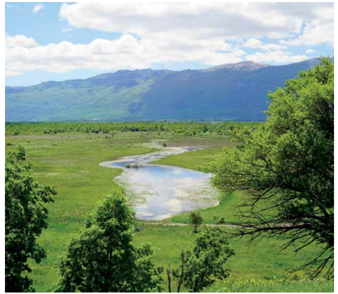
Slika: Goan Topić – Privremeno jezero u Livanjskom polju