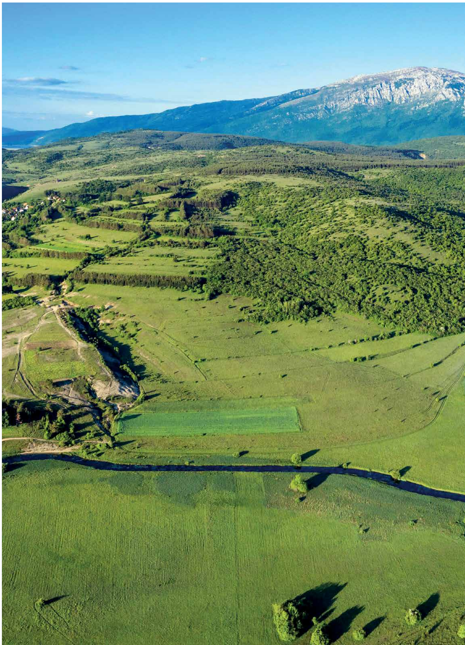
Slika: Marina Momuza