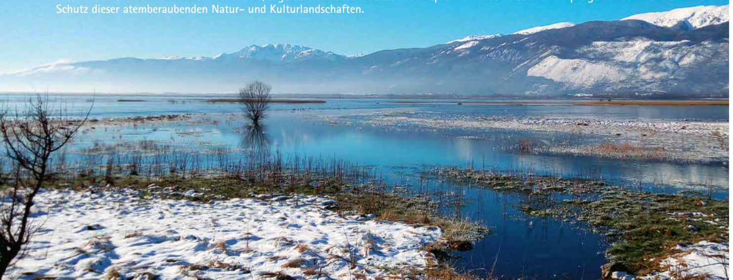
Bilder: Goran Topić – Livanjsko Polje; Porträt: Manuel Schweizer

Es war ein Tag im Frühling als Biljana begann, Gorans Liebe zu den Poljes zu verstehen. Das Karstfeld Livanjsko Polje hatte sich in einen riesigen See verwandelt. Schneebedeckt spiegelten sich die umliegenden Berge zusammen mit den Kronen überfluteter Bäume im Wasser. Neben dem Geräusch brechenden Eises fesselte ein Dröhnen Biljanas Aufmerksamkeit. Das erste Mal in ihrem Leben hörte sie, wie es klingt, wenn ein See durch Schlucklöcher im karstigen Untergrund versinkt. „Spektakulär!“ Das war das Wort, das Goran am häufigsten verwendete, wenn er von den Poljen sprach. Jetzt wusste sie, was er meinte. Für Goran selbst war es Liebe auf den ersten Blick gewesen: „So seltene Vogelarten wie Wachtelkönige, Wiesenweihen, Braunkehlchen sind dort überall. Diese Vielfalt haut mich immer wieder um“, sagt Goran. Heute arbeitet das Ehepaar für Naše Ptice und kämpft gemeinsam für den Schutz dieser atemberaubenden Natur- und Kulturlandschaften.