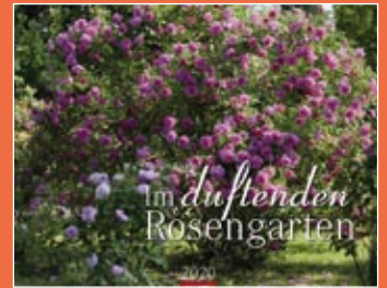
Duftender Rosengarten 2020 Format 44 x 34 cm € 19,99