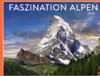
Faszination Alpen 2020 Format 44 x 34 € 9,99