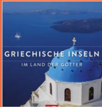
Griechische Inseln 2020 Format 46 x 48 cm € 25,00