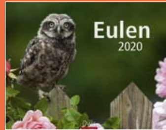
Eulen 2020 Format 44 x 34 € 19,99