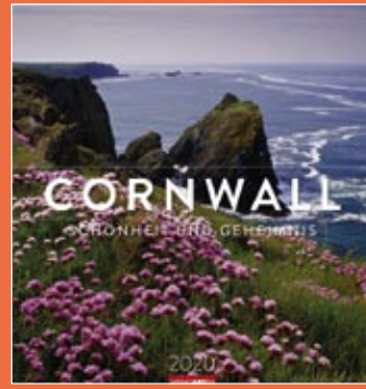
Cornwall 2020 Format 46 x 48 cm € 25,00