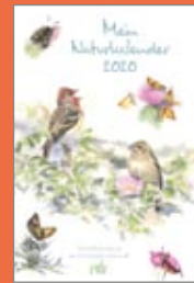
Tischkalender 2020 Format 16 x 23, 136 Seiten € 19,99