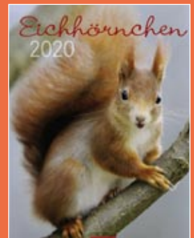
Eichhörnchen 2020 Format 30 x 39 cm € 14,99