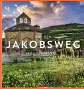
Auf dem Jakobsweg 2020 Format 46 x 48 cm € 25,00