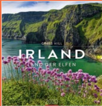
Irland 2020 Format 46 x 48 cm € 25,00