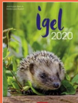
Igel 2020 Format 30 x 39 cm € 14,99