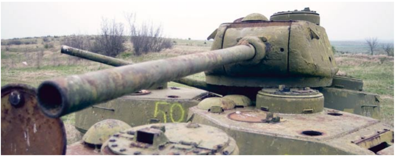
Alte Panzergeschütze im Sakar-Hügelland am Grünen Band Europa in Ruzhitsa, Bulgarien.