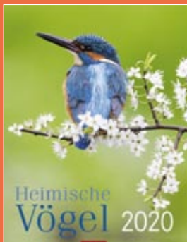
Heimische Vögel 2020 Format 30 x 39 cm € 14,99