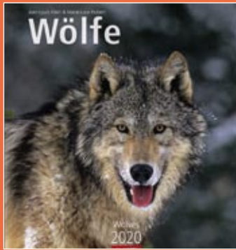
Wölfe 2020 Format 46 x 48 cm € 25,00