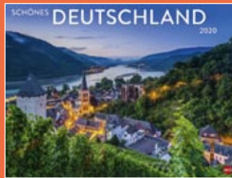
Schönes Deutschland 2020 Format 44 x 34 cm € 9,99