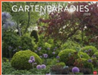
Gartenparadies 2020 Format 44 x 34 € 9,99