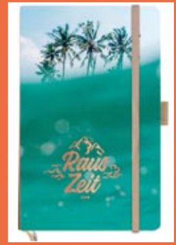
Rauszeit 2020 Format 13 x 21 cm, Kalenderbuch € 17,99