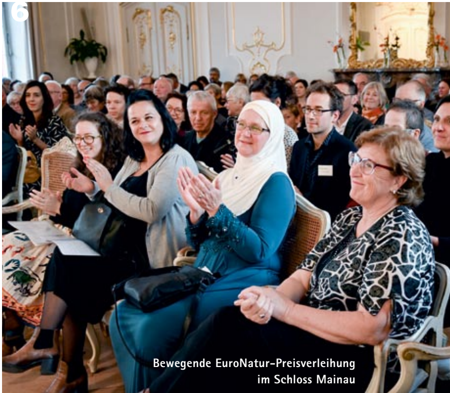
Bewegende EuroNatur-Preisverleihung im Schloss Mainau